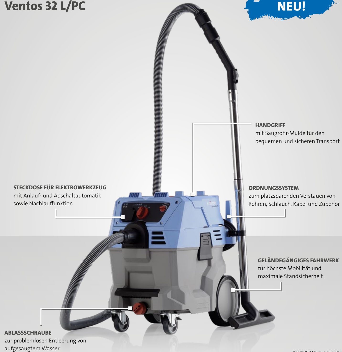
# 580000 Ventos 32 L/PC