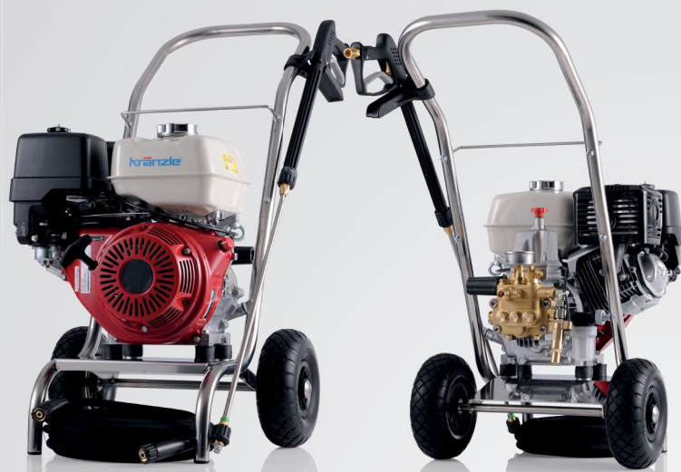
Profi-Jet B 13/150 Profi-Jet B 10/200 Profi-Jet B 16/220 Profi-Jet B 20/200 Profi-Jet B 16/250